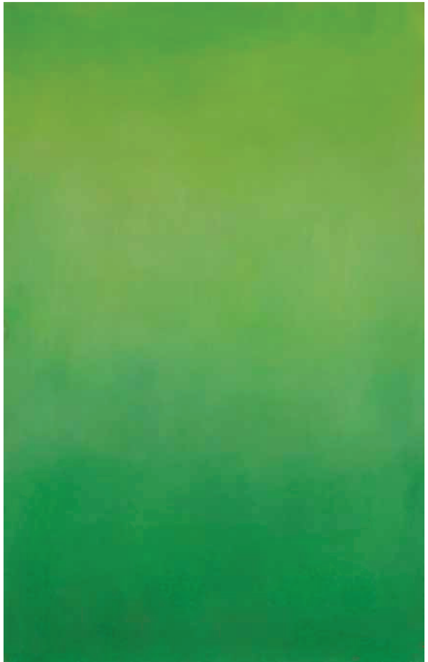
Farbmeditation, 2012, Tempera auf Leinwand, 45x70 cm

«Als ganz kleines Kind fand ich ein rotes angebrochenes Bleistiftstück und entdeckte, dass es Spuren hinterlässt, Spuren von meiner eigenen Hand gezogen. Es öffnete sich mir ein Raum der freien Entfaltung. Diese Faszination des Kindes, eigenständig etwas zu gestalten, hat mich nie mehr verlassen. Sie bestimmte mein Leben und meine Berufung. Die Kunst selbst und