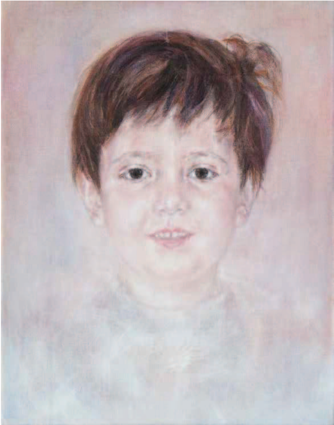
Isaac, 2018, Aquarell/Pflanzenfarbe auf Leinwand, 40x50 cm

kreativen Beziehung. «Farbe ist für mich transparent, sie lässt es zu, dass ich immer wieder tiefere Schichten und Aspekte erforschen kann.» Es gibt Werke von ihr wie dieses grüne Bild, das – unter Zurückhaltung eigener Wünsche und Vorstellungen – allein dafür geschaffen scheint, damit sich Farbe entfalten kann.